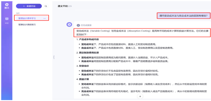
图 3: 通义辅助课中学习实例展示