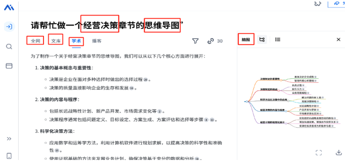
图 4: 秘塔 AI 辅助课后学习实例展示

在课后巩固提升阶段, 通义、秘塔 AI 等 AI 工具智能分析学生学习弱点, 精准推送针对性练习与资源, 助力学生巩固薄弱环节, 强化知识掌握, 补齐学习短板。学生通过反复练习和个性化反馈, 实现查漏补缺, 为后续学习筑牢基础。通义凭借精准出题功能, 依据学生薄弱点个性化推送例题, 并提供详细解答过程, 有效提升学生对课程内容的理解。学生在通义管理会计工具的文字输入区, 输入课程知识点, 3 分钟内即可生成带背景、问题及解答提示的例题, 引导解题思路; 秘塔 AI 通过智能整理和定制学习功能, 为学生梳理知识点, 满足差异化学习需求。学生选择检索模式与类型, 输入“经营决策章节思维导图”等指令, 秘塔 AI 可快速生成知识大纲, 并支持一键转化为思维导图, 提供大纲与导图下载, 帮助学生梳理案例逻辑, 把握知识要点, 如图 4 所示。